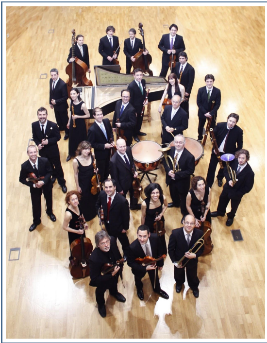
La Orquesta Barroca de Sevilla en el Festival Internacional de Santander, Sala Pereda.

La esperada Orquesta Barroca de Sevilla ha traído al Festival Internacional de Santander un programa integrado por los Brandeburgo bachianos 3 (BWV 1048), 5 (BWV 1050) y 6 (BWV 1051), además de la Suite nº 2 en si menor (BWV 1067). Un repertorio obviamente conocido mas no por ello carente de atractivo.