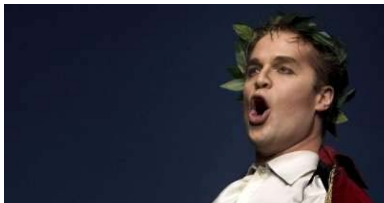
Imagen de una actuación en el Teatro de la Maestranza.

Sevilla.- Tras 17 años de existencia, el Teatro de la Maestranza por fin ha saldado la deuda pendiente con el compositor Georg Friedrich Haendel al estrenar anoche, bajo la magia del desaparecido Herbert Wernicke, la que sin duda es una de sus mejores óperas, "Giulio Cesare in Egitto".